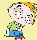
Decaimiento y sueño.