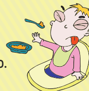
Rechazo al alimento.

Concurrí URGENTE al centro de salud o al hospital más cercano para hacer una consulta